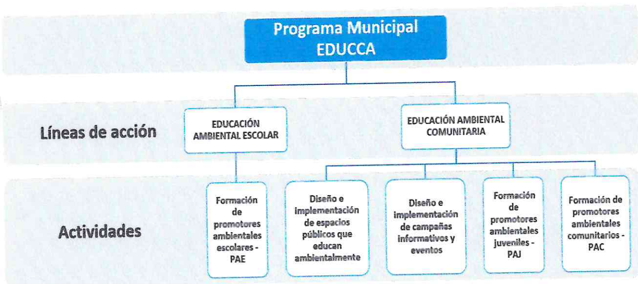
Gráfico N° 01: Líneas de Acción y actividades

El Programa Municipal EDUCCA – SAMA contempla dos líneas de acción y cinco actividades